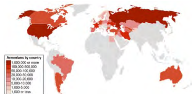
Población de Armenia alrededor del mundo

Tiene una población de 2.986.000 personas y el 63% corresponde a áreas urbanas (1 millón de personas en Yerevan, la capital, según el censo de 2011). Tiene tasas de crecimiento poblacional bajas que se deben al bajo índice de natalidad y a la emigración. Desde el año 2008, alrededor de 200.000 personas emigraron del país (dos tercios a Rusia y el resto a Europa o Estados Unidos).